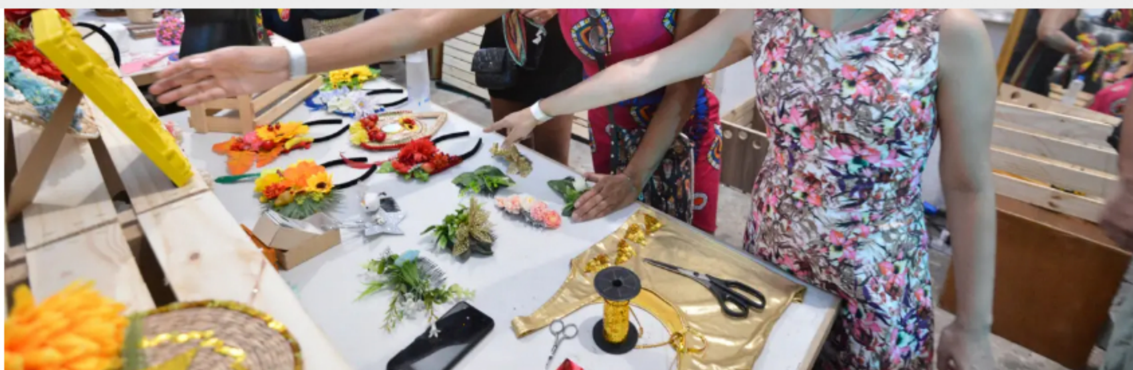
Casabloco: festival faz sua estreia no MAM com diversas atrações

O festival CasaBloco , que ocupa os jardins do MAM entre os dias 25 e 28 de janeiro, contará todos os dias com feira gratuita de 36 empreendedoras e artesãs repleta de peças que são a cara do Carnaval. Pequenas marcas do Rio vão oferecer adereços, acessórios, fantasias e maquiagens para foliãs e foliões em mais uma edição da “ RUA é nossa! ”.