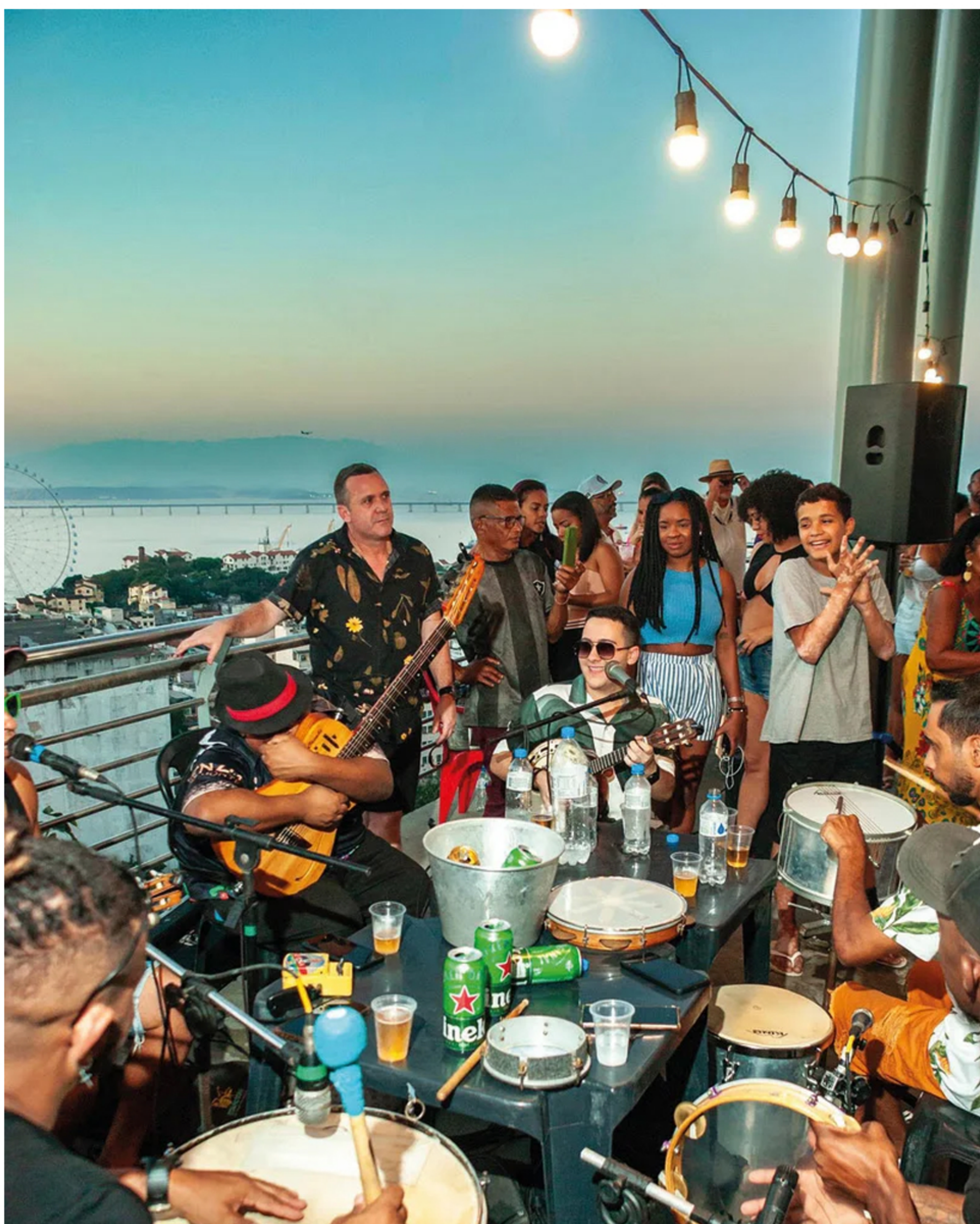
Samba da Providencia

Ao longo dos anos, o Almanaque impresso tem explorado diferentes facetas da cidade. Em 2024, destacou os locais onde tribos urbanas e grupos diversos se encontram. Em 2023, mapeou os espaços inovadores do Rio. Já em 2022, retratou a resiliência da cidade na retomada pós-pandemia. Agora, em 2025, a proposta é levar o leitor para o alto, mostrando o Rio de Janeiro de um ângulo único e inesquecível.